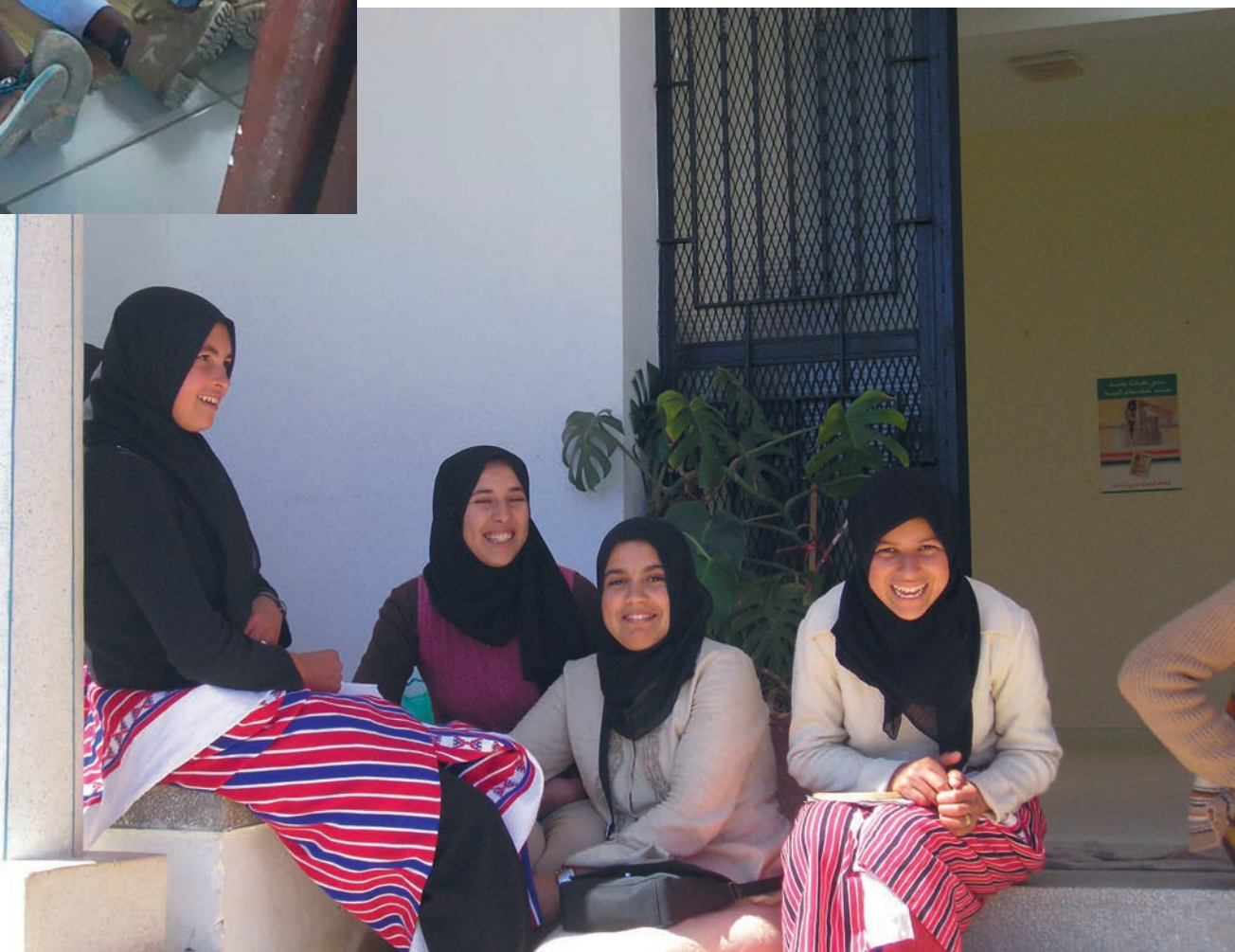
Projecte d'un Centre per a la Formació Integral de Dones a la Comuna Rural de Beni Said.