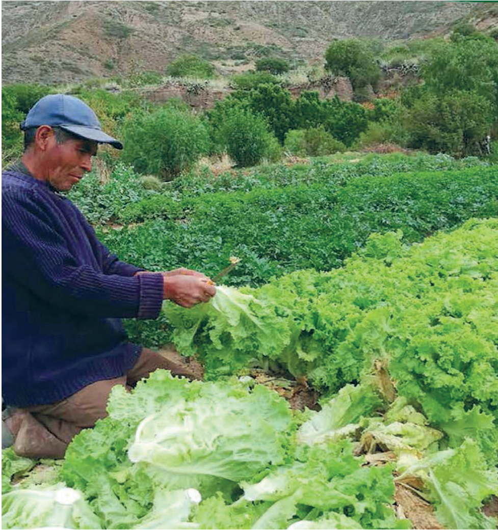
Collita d'hortalisses a Potosí (Bolívia).

MOHAMED FUAD AMRANI «La mala gestió dels recursos naturals dins d'aquest sistema consumista és el que genera bosses d'exclusió i de pobresa»