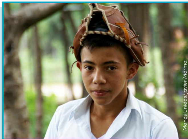
Manos Unidas/Javier Marmol