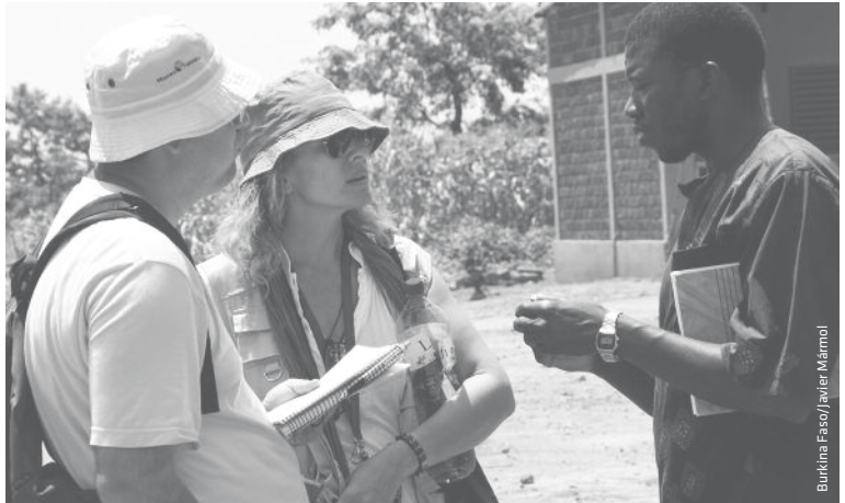
Burkina Faso/Javier Marmol